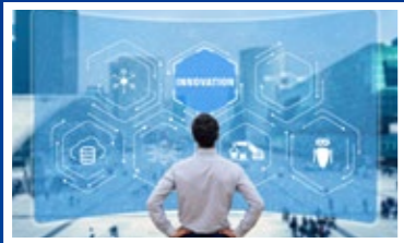
経営の意思決定が早くより良く