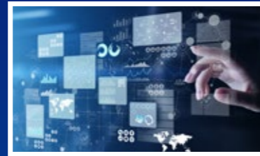
アドバンスアナリティクスの最低採用率