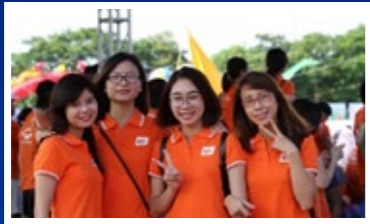
顧客のデータから価値を迅速に提供するサービス形態